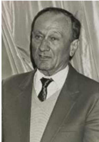
L'Ambassadeur Paul Blanc