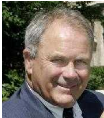
Jacques Godfrain Président de l'AFAL

L'AFAL (Association Francophone d'Amitié et de Liaison) présidée par Jacques GODFRAIN, ancien ministre, a réuni le 11 Septembre 2014 le Forum des Associations Francophones dans la perspective du Sommet des chefs d'Etat et de Gouvernement ayant le Français en partage qui aura lieu les 29 et 30 Novembre à Dakar.